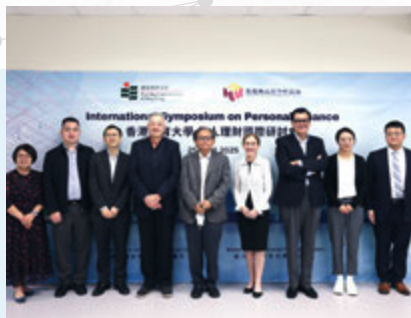
全球顶尖机构的杰出学者和金融实践专家赴教大参加个人理财国际研讨会