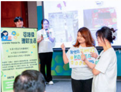
个人理财大使计划