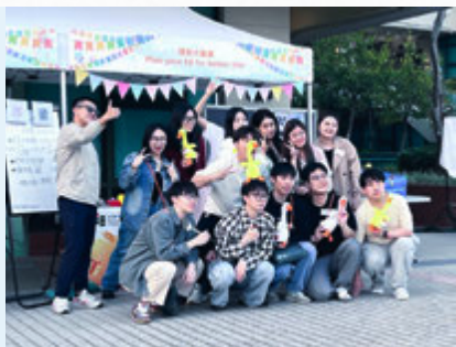
教大校友日理财游戏摊位