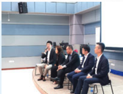
恒生银行团队分享香港银行业中的财富管理