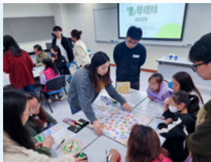
学生担任亲子理财桌游导师