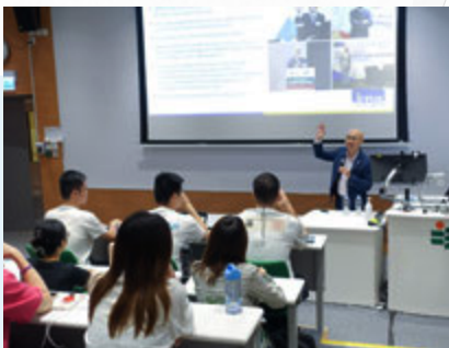
香港财务策划师学会分享大湾区的财富管理与理财规划职业发展