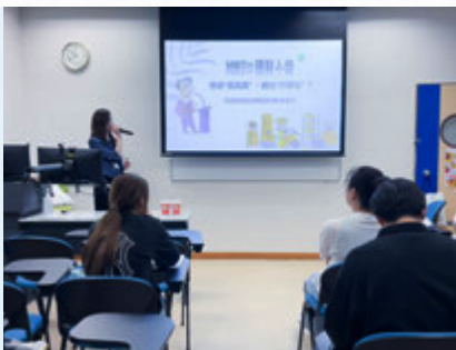
学生主持理财教育讲座