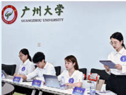
粤港澳高校会计案例大赛