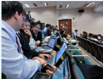
香港 MBS 数字经济商业模拟比赛