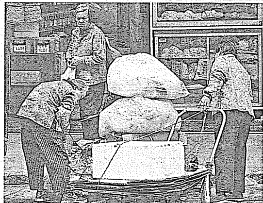
筆者指出，香港經常被批評貧富懸殊嚴重，而選擇性的福利是有效減低問題的方法之一。(資料圖片)

每一個香港市民都希望見到長者老有所依，但亦期望公帑用得其所。筆者認為兩者亦沒有衝突，長者生活津貼便是一例。