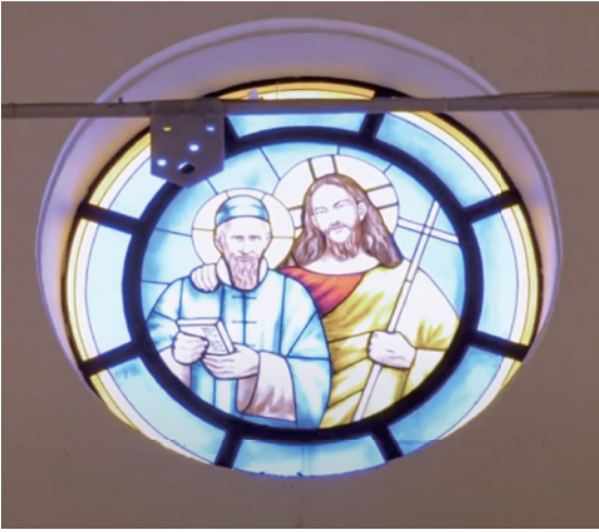
鹽田梓聖若瑟小堂內的彩玻璃