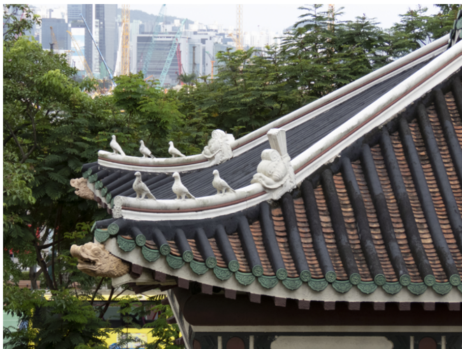
屋脊上的龍、白鴿和吻獸