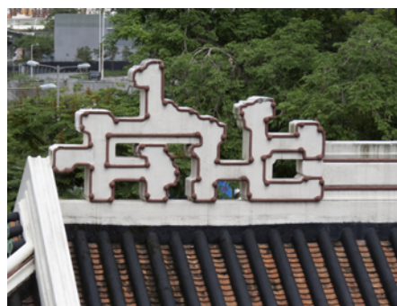
聖三一座堂屋頂的夔龍紋