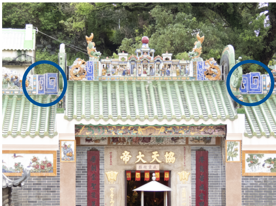
西貢協天宮 （藍色磁磚是博古紋）