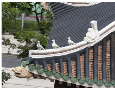
聖三一座堂屋頂的龍（圖左下角）