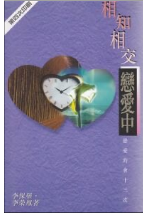
相知相交戀愛中：戀愛約會十三次 (1995) 出版社：天道書樓 作者：李保羅、李榮鳳