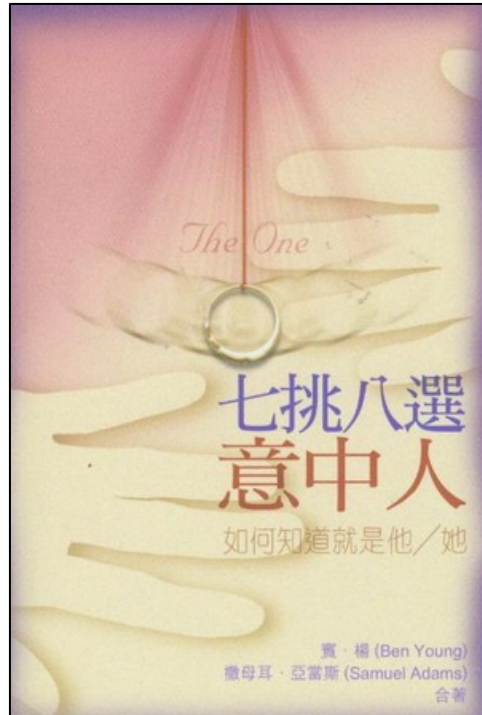
七挑八選意中人：如何知道就是他／她 The one: a realistic guide to choosing your soul mate 出版社：浸信會 (2006) 作者：賓·楊、撒母耳·亞當斯 (Ben Young, Samuel Adams) 譯者：便雅憫設計製作公司