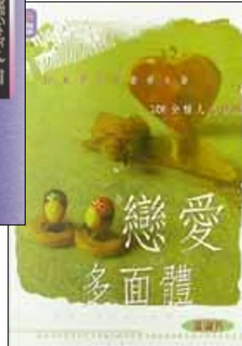
戀愛多面體 出版社：突破 (2000) 作者：溫淑芳