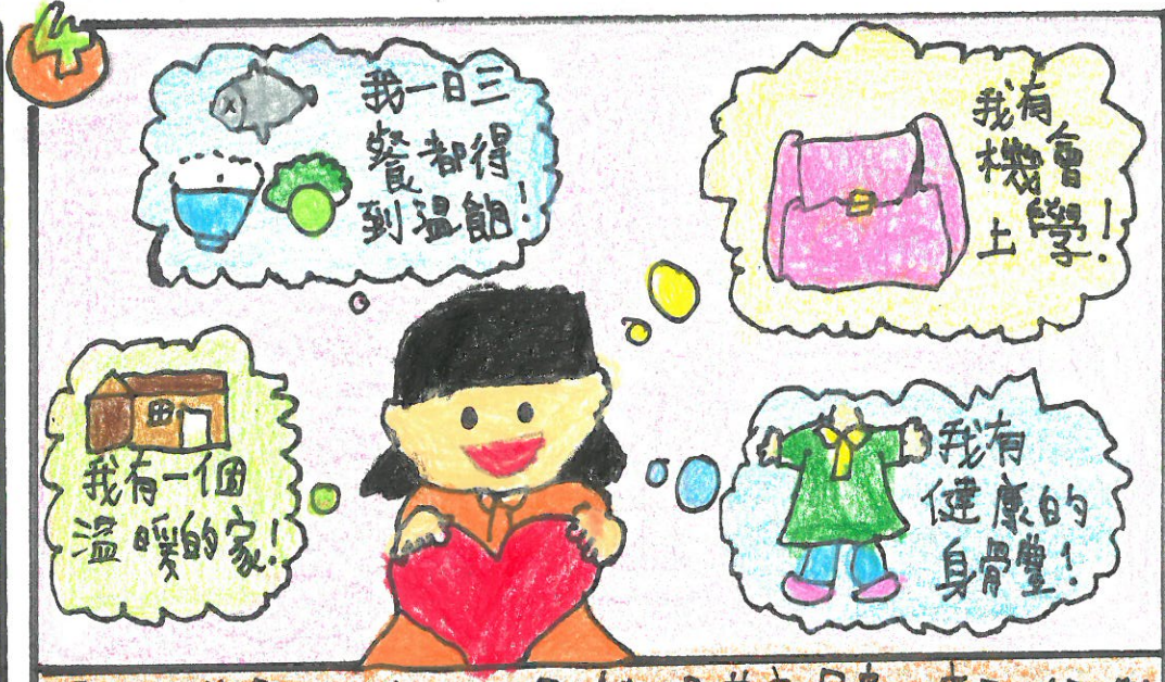
恩典太美麗: 我擁有的,雖然不是甚麼昂貴的東西,但我已經很幸福了!