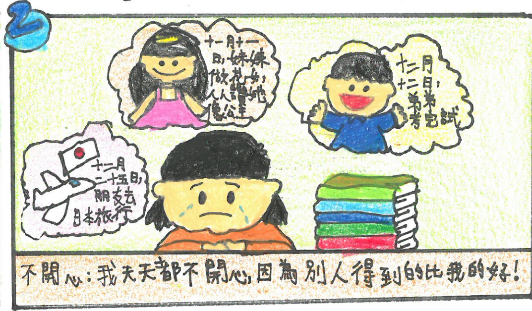
不開心: 我天天都不開心,因為別人得到的比我的好!