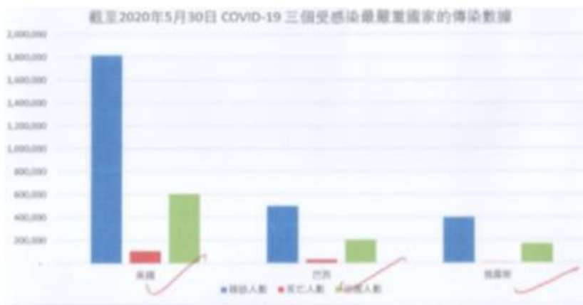
三個受感染最嚴重的國家