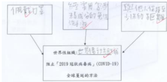
世衛阻止疫情全球蔓延的方法