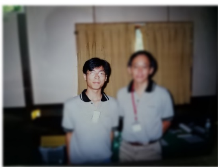
大學二年級時到代表香港到台灣交流， 與1997年諾貝爾物理學獎得主朱棣文 (Steven Chu)合照