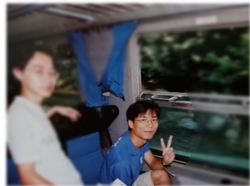
大學三年級時乘火車到意大利 進修