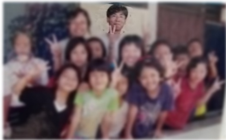
到泰北窮困村落服事