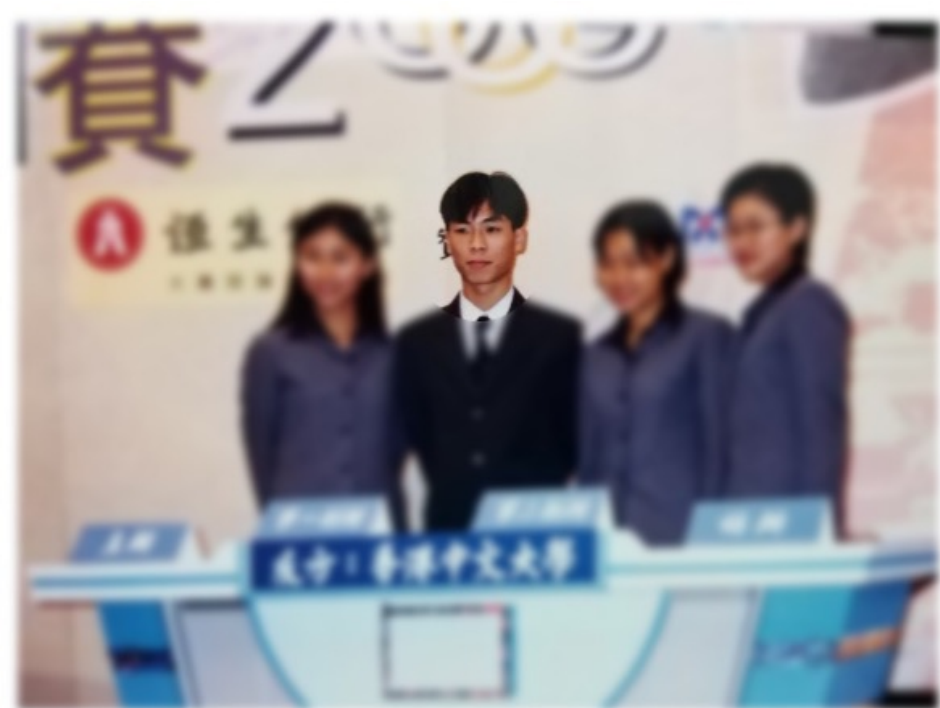
中大粵語辯論校隊 (大學一年級時)