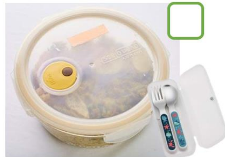
自備可重餐盒及餐具