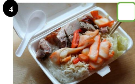
4 使用即棄塑膠餐盒及餐具