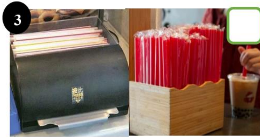
3 使用即棄塑膠飲管