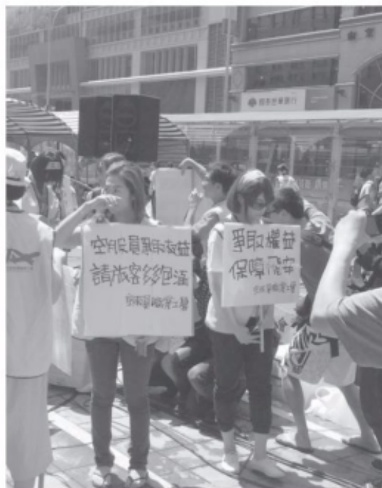
▲ 華航空服員舉牌抗爭

或是團體利益而已，其漣漪效果更將勞動權益不容剝奪的訊息傳遞到社會各個角落。透過空服員在罷工過程中所展現的高度團結力量，相信已經打動沉默且被壓迫許久的勞工，觸發他們的動力和勇氣。而這次的罷工之後，未來會不會有更多各行各業的勞工、工會走上街頭，雖是未知之數，但罷工所產生充權，將促使忍受不公平待遇多時的勞工逐步邁向團結，而台灣未來是要經由罷工與衝突才能累積改變？還是透過一次次公開公平的勞資協商談判，為勞資雙方找到雙贏的路徑，取決於資本家的選擇。（作者均為香港教育大學亞洲及政策研究學系學生）