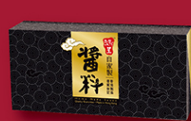
自家製醬料禮盒 (XO醬、蝦乾辣油、紅糟醬及鹹柑橘各1樽) 每盒 HK$288