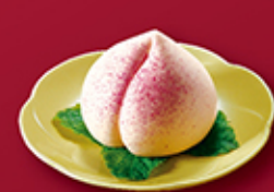
福壽蟠桃 (全黃蓮蓉包6隻) 每盒 HK$108