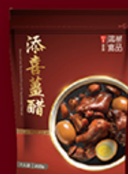
添喜薑醋 (300克) 每包 HK$60