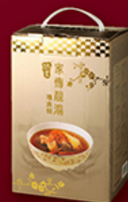
家傳靚湯禮盒裝 金瓜燉魚湯 / 海底椰雪梨燉乳鴿 / 猴頭菇螺片燉豬展 / 蟲草花瑤柱燉老雞 每盒 HK$228