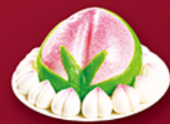
3D子母蟠桃包 每盒 HK$188