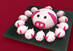
3D子母小豬啖包 每盒 HK$248