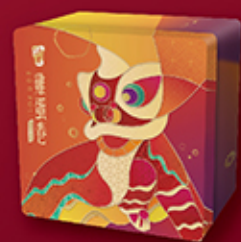
鴻星雞蛋卷 每盒 HK$108