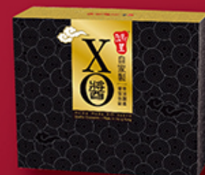
自家製XO醬禮盒 (兩樽裝) 每盒 HK$238