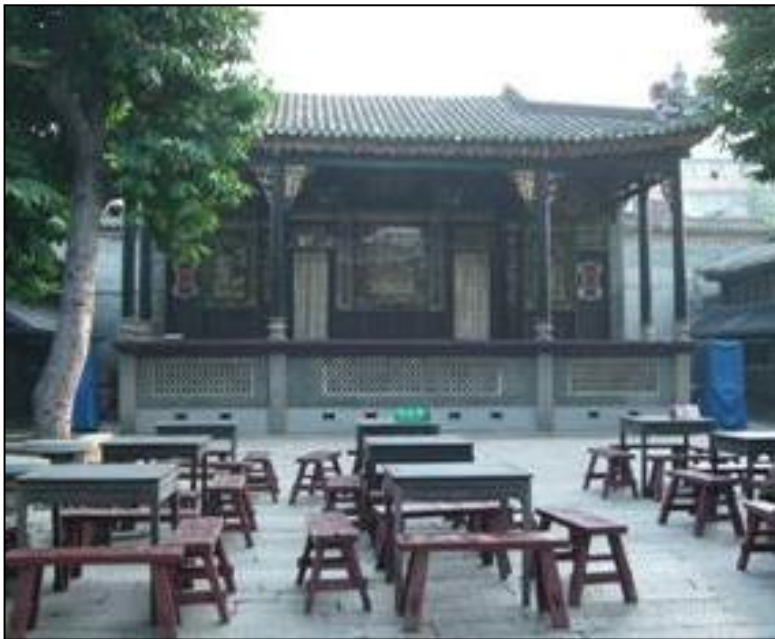
粵劇發源地(佛山)： 佛山祖廟內的萬福台

● ● ● 傳統中國社群在喜慶、節日或地方神誕時，舉行多項慶祝活動，地方居民合資聘請戲班演出戲曲，這就叫「神功戲」，也是中國戲曲演出的原本場合。